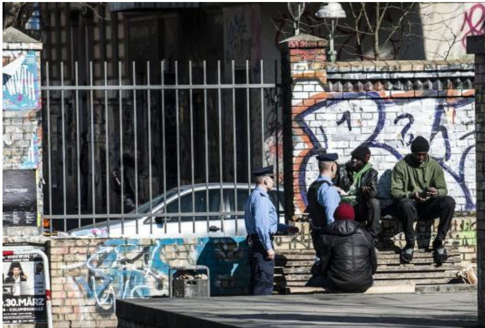
"Rote Linie überschritten": Täglich durchkämmen Polizisten den Görlitzer Park