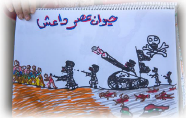
Angriff der ISIS (Mädchen, 8 J.)

Bronstein et al., 2011, 2013; Fazel et al., 2005; Lustig et al., 2004; Metzner et al., 2016; Witt et al., 2015